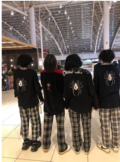
Несовершеннолетние, относящие себя к ЧВК «Редан»

Отличительной особенностью подростков субкультуры, является черная одежда с изображениями паука и цифры 4 и клетчатые штаны. Цифра 4 на пауке – созвучие японскому слову «смерть».